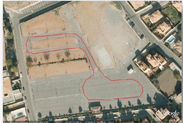
Circuito 2: 350 m desnivel 4,0m