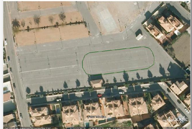
Circuito 1: 150 m desnivel 0,5m